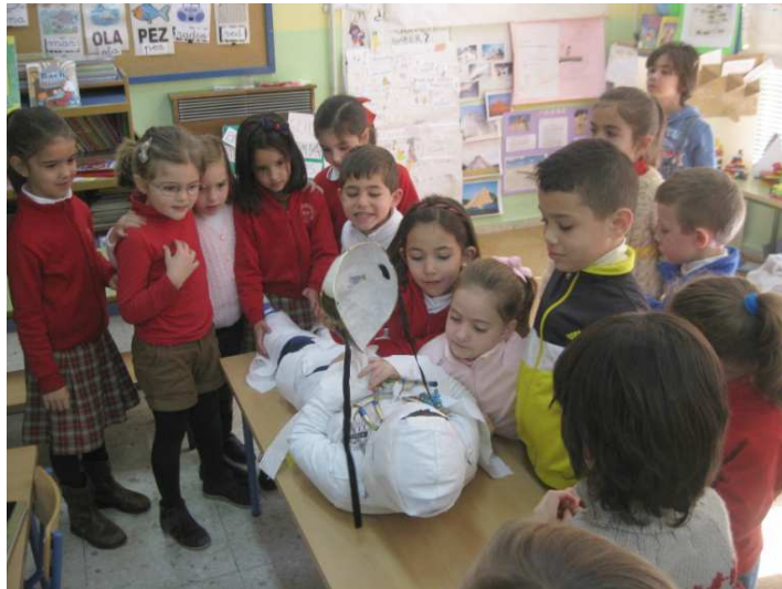
Hacemos nuestra momia