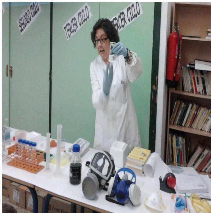
Nos visita una científica universitaria