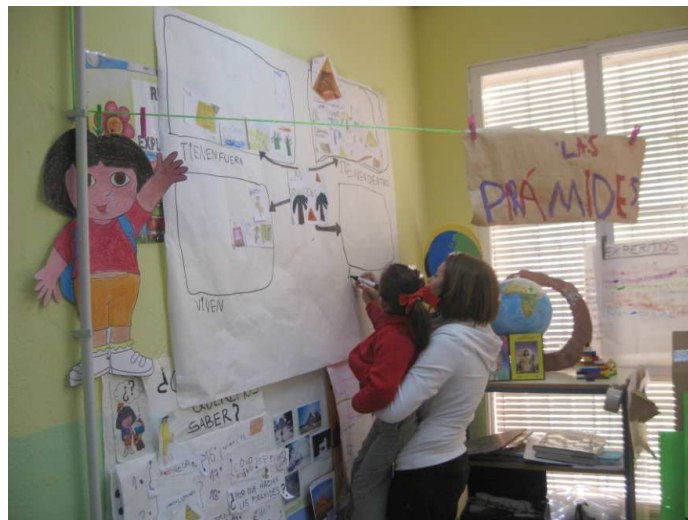
Niña dibujando el mapa conceptual sobre ‘Las Pirámides’

Los resultados obtenidos han sido 24 PT para el ciclo de Ed. Infantil 3-6. Dichos proyectos se está trabajando para darle difusión por diversos medios: artículos de revistas de innovación y han sido presentados en la sesión final de Prácticum II de Grado de Ed. Infantil en la Facultad de CC de la Educación mediante la elaboración de un póster titulado ‘Desarrollo de las Inteligencias Múltiples a través del Método de Proyectos de Trabajo’ Algunas imágenes recogen la participación de los niños en diversas situaciones de enseñanza-aprendizaje puestas en marcha: