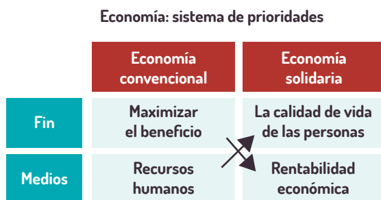
Ilustración 1: Askunce, Carlos (2007). Diccionario de Educación para el desarrollo.

En el Diccionario de Educación para el Desarrollo (Diccionario de Educación para el Desarrollo, 2007:107), Carlos Askunce 1 nos adentra en este concepto: “La Economía Solidaria parte de una consideración alternativa al sistema de prioridades en el que actualmente se fundamenta la economía neoliberal. Se trata de una visión y una práctica que reivindica la economía como medio –y no como fin– al servicio del desarrollo personal y comunitario, como instrumento que contribuya a la mejora de la calidad de vida de las personas y de su entorno social. Una concepción que hunde por tanto sus raíces en una consideración ética y humanista del pensamiento y de la actividad económica, que coloca a la persona y a la comunidad en el centro del desarrollo.”