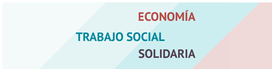
Ilustración 2: REAS (2011). Carta de Principios de la Economía Solidaria

Con esta doble óptica proporcionada por los enfoques del Trabajo Social y de la ESS, podemos apreciar que la práctica de ambas disciplinas las muestra como herramientas transformadoras guiadas por principios rectores inherentes a ambas como la justicia social, los derechos humanos, la solidaridad, la igualdad, el compromiso con el entorno o el bienestar social.